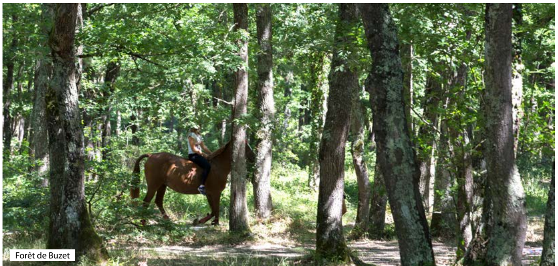
Forêt de Buzet

► A Montjoire, le Catharisme et l'Inquisition ont laissé de nombreuses traces sur la toponymie ! On retiendra le lieu-dit Les Convertigues qui était le lieu où l'Inquisition réunissait les nouveaux convertis, ou encore la côte du Cramantino qui était l'endroit où on brûlait les hérétiques... Parlant, non ?