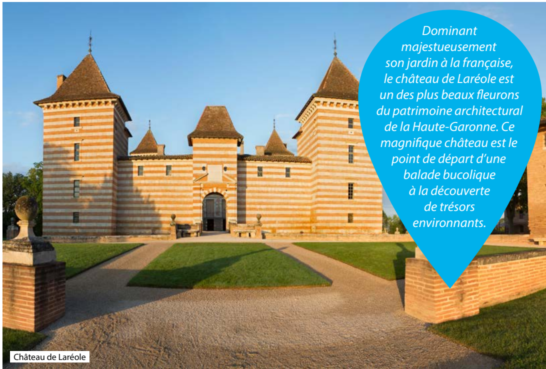
Château de Laréole

Dominant majestueusement son jardin à la française, le château de Laréole est un des plus beaux fleurons du patrimoine architectural de la Haute-Garonne. Ce magnifique château est le point de départ d'une balade bucolique à la découverte de trésors environnants.