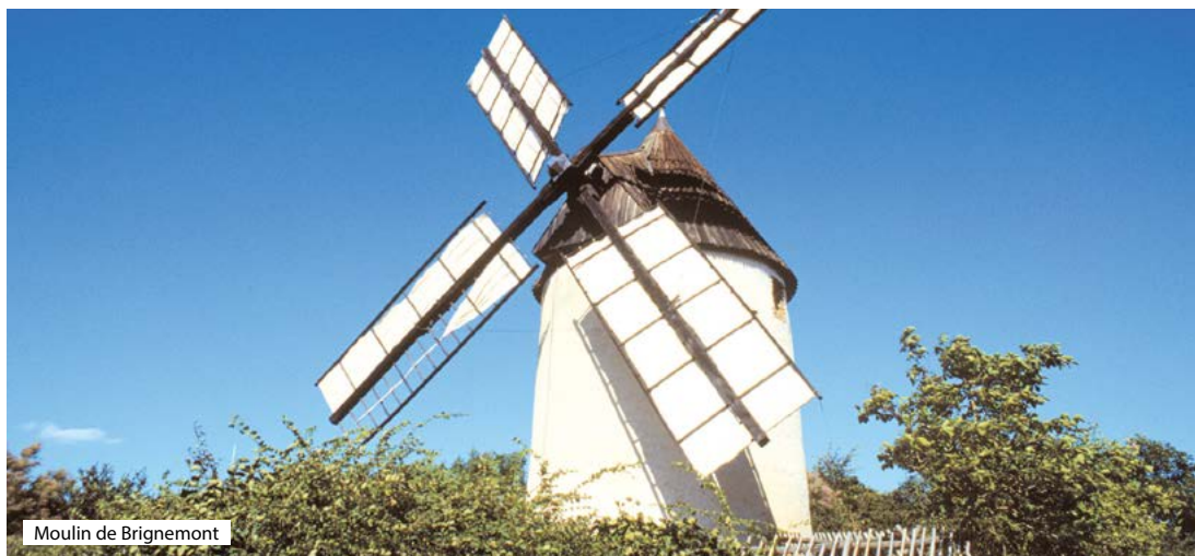
Moulin de Brignemont

Cadours a aussi été rendu célèbre par son circuit automobile utilisant les 13 virages de trois départementales. Le « Grand Prix de Cadours » obtient son homologation en 1949 et intègre le calendrier international de Formule 1 ! De grandes pointures de la course automobile sont présents sur la ligne de départ. Tous les deux ans, une présentation de voitures de collection commémore les grandes heures du circuit.