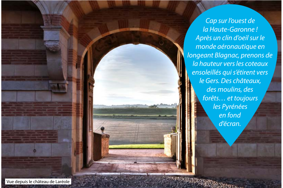
Vue depuis le château de Laréole

Cap sur l'ouest de la Haute-Garonne ! Après un clin d'oeil sur le monde aéronautique en longeant Blagnac, prenons de la hauteur vers les coteaux ensoleillés qui s'étirent vers le Gers. Des châteaux, des moulins, des forêts... et toujours les Pyrénées en fond d'écran.