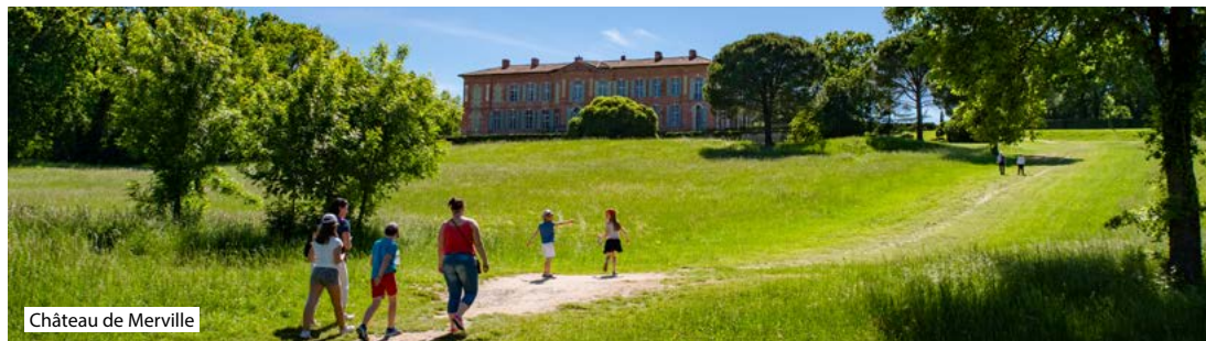
Château de Merville

A l'époque moderne les coxiens vivaient de l'industrie potière. Parmi les différents colorants employés, c'est le bleu de Cox qui a fait les heures de gloire de ce village. Les artisans potiers avaient un large savoir-faire et produisaient autant de pièces de première nécessité pour les moins fortunés que des réalisations finement ouvragées (vaisselle, poteries). Le musée installé dans une bâtisse en terre crue, ancienne fabrique de l'un des derniers potiers, abrite un four aux dimensions imposantes.