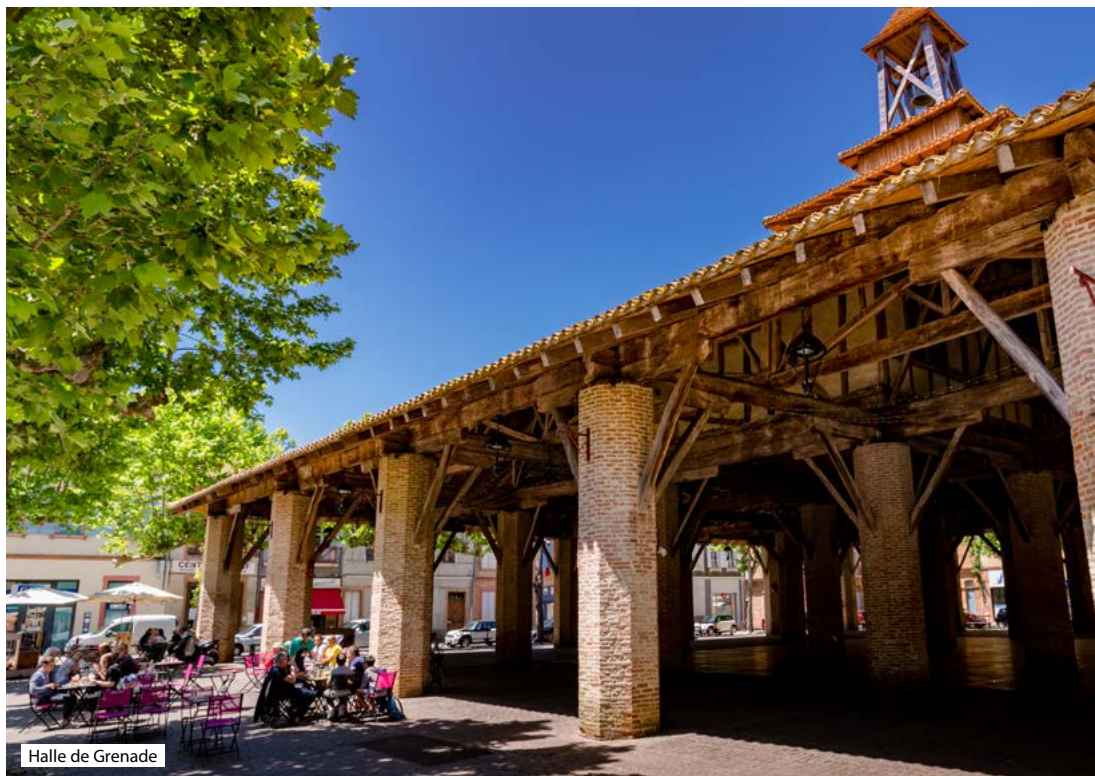
Halle de Grenade

Pendant votre séjour, trouvez toutes les infos pour découvrir, visiter, où manger, se divertir... :