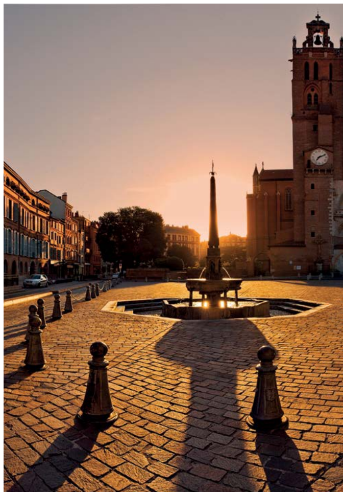
Cathédrale Saint-Etienne à Toulouse