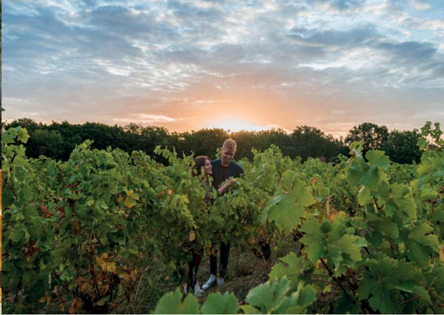
Vignoble de Fronton