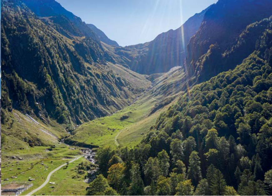
Hospice de France