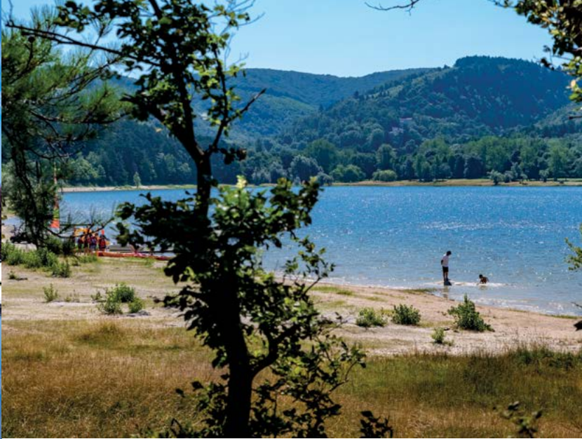
Lac de Saint-Ferréol à Revel